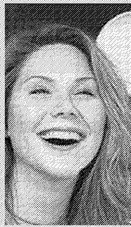
Erika Lust.

En esa línea, Lust publicó a finales de 2008 Porno para mujeres . Una suerte de biblia iniciática de cine X para neófitas. “Si las mujeres participamos en el discurso de la pornografía, podremos explicar a los hombres nuestra sexualidad de manera muy explícita”, explicó Lust a ADN.es. “Antes sexo era sinónimo de algo sucio. Ahora, puede ser algo chic”.