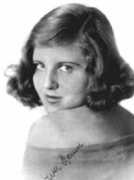
Eva Braun.

-Sobre todo descubrir que hombres como Hitler, Mao o Stalin fueron casi 'sex-symbols'. Adolf Hitler recibió más cartas de fans que Mick Jagger y los Beatles juntos. Y Mussolini, más de 30.000 al mes. Su seducción era total.