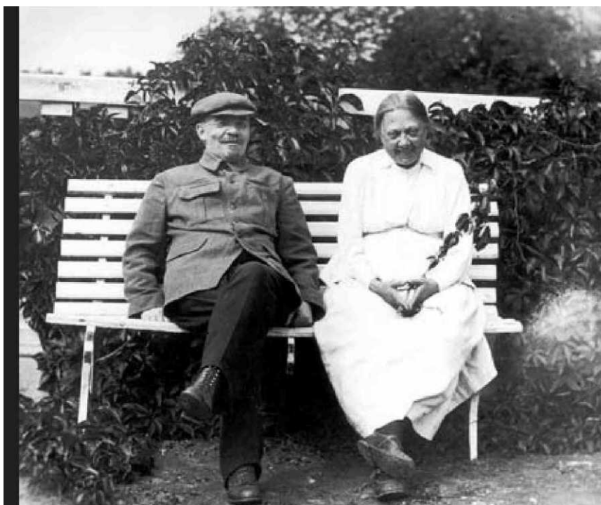
A la izquierda, Lenin y su esposa, Nadia Krúpskaia. Arriba a la derecha, Paul Joseph y Magda Goebbels. Abajo a la derecha, Mao Zedong y su cuarta esposa Jiang Qing.